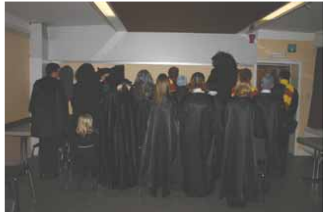
Le Corps Professoral la seule photo de cul autorisée...