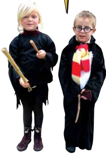
Hermione et Harry