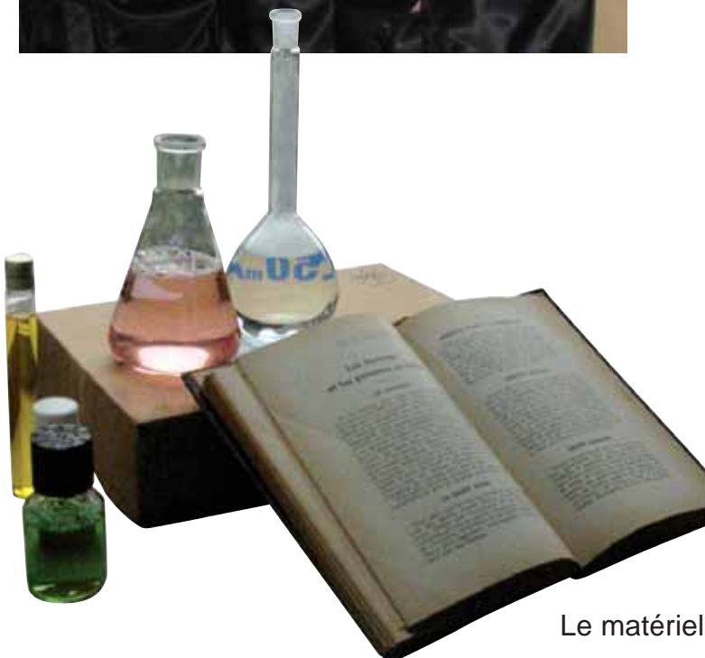
Le matériel pour tester vos baguettes