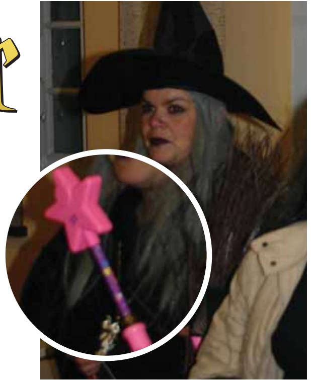
La plus belle baguette du week-end